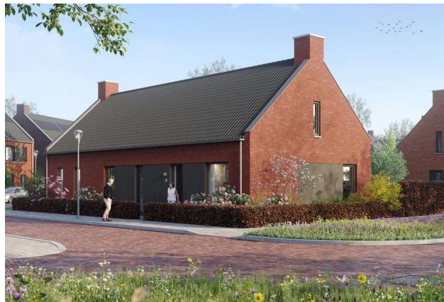
Woningen zuidzijde Verlengde Schoolstraat