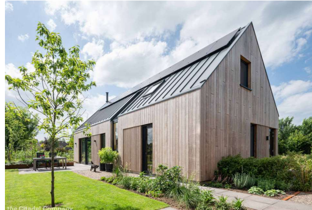
Woningen noordzijde Verlengde Schoolstraat