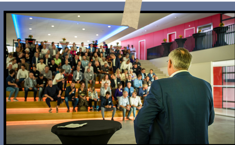
Derde kamer bijeenkomst