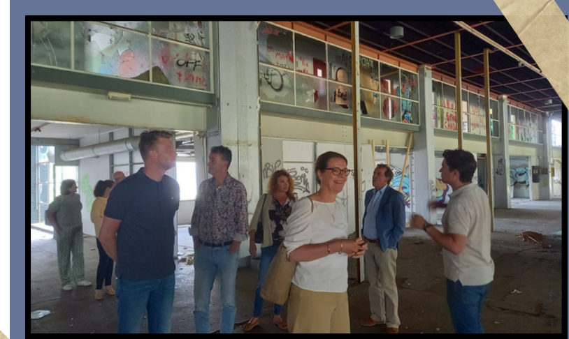
Bezoek Makeport Mercurius