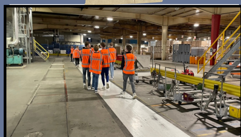
Technasium on tour