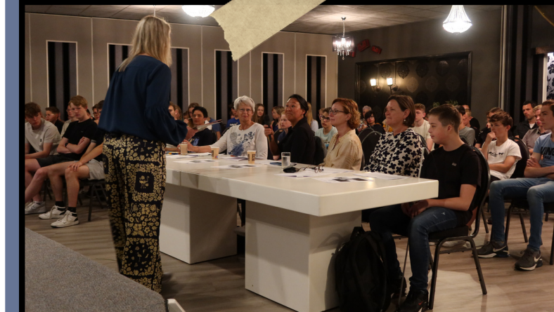
Technasium finale Van Gogh