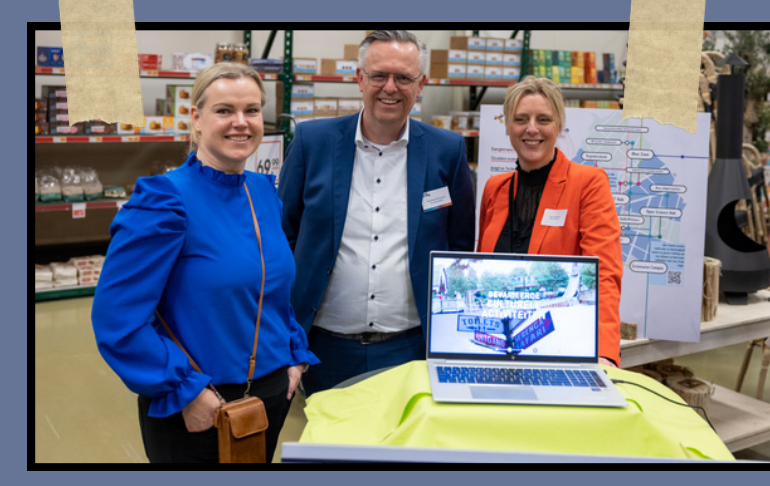
Ondernemend Emmen event