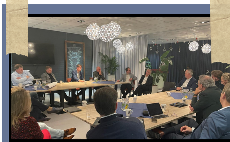
Bijeenkomst Program Board