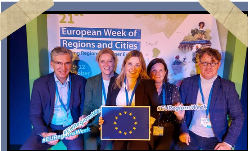
European week '23