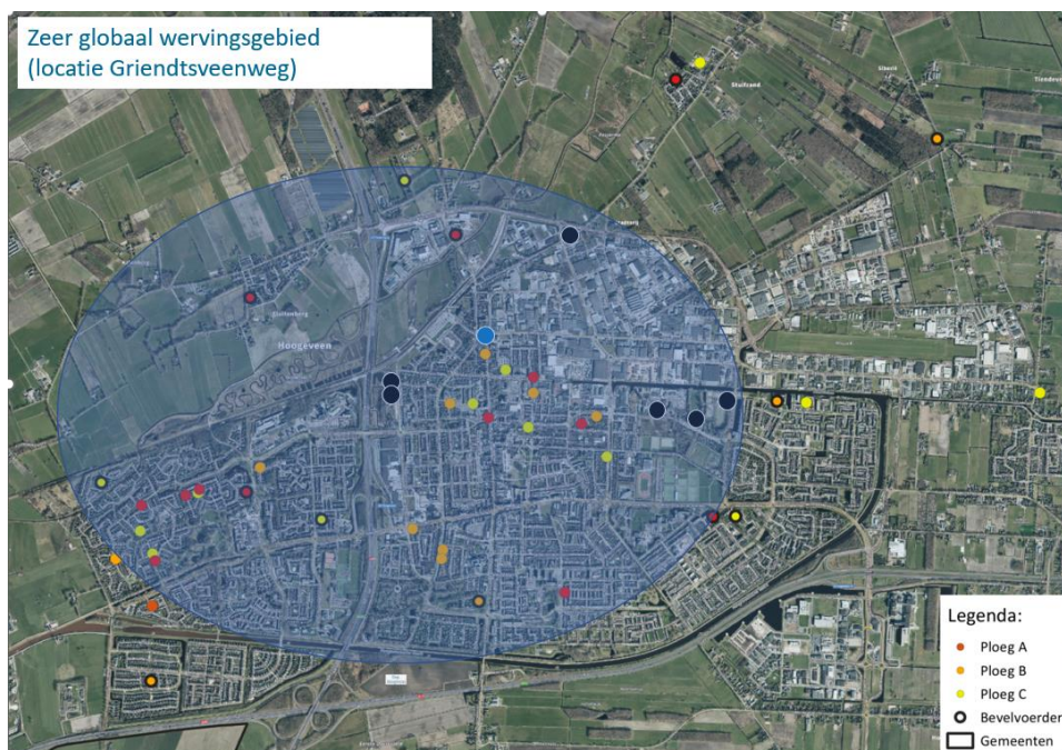
Figuur 2: Zeerglobaal wervingsgebied Griendtsveenweg. Locatieonderzoek 2022