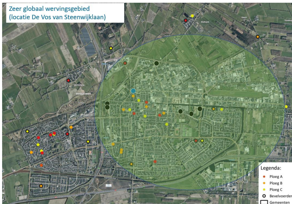
Figuur 3: Zeer globaal wervingsgebied Vos van Steenwijklaan. Locatieonderzoek 2022